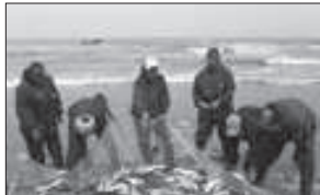
رئیس اداره حفاظت محیط زیست شهرستان