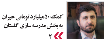
کامک ۵۰ میلیارد تومانی خیران به بخش مدرسه سازی گلستان

شنبه ۲۳ دی ۱۳۹۶ / سال نوزدهم / شماره ۱۶۷۰ / صفحه ۵۰۰ تومان