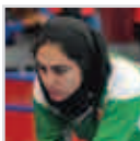
خواهران سلامت در جایگاه سوم و دهم رتبه‌بندی بانوان