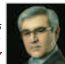
توسعه گردشگری در دستور کار شهرداری گرگان قرار دارد

چهارشنبه ۲۲ شهریور ۱۳۹۶ / سال نوزدهم / شماره ۱۶۲۴ / صفحه ۵۰۰ / تومان