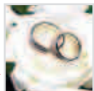
ثبت بالغ بر هزار مورد ازدواج زنان ایرانی با مهاجران افغان در گلستان